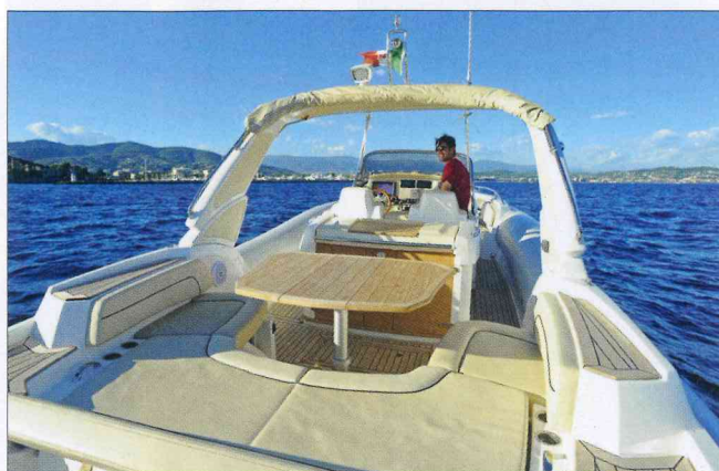
La partie arrière du cockpit est occupée par un salon en U qui se distingue par ses dossiers intégrés à des plats-bords surélevés.