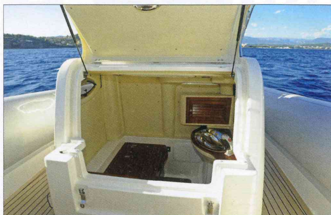
La console dévoile un cabinet de toilette avec vasque inox et douche. La hauteur sous plafond est cependant limitée à 1,50 m.

Le pilote jouit d'une excellente position en appui ou assis. Notez l'emplacement des manettes de gaz. L'ergonomie est parfaite.